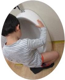
2月から立便器を使用しています