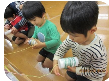
糸巻きあそび 手首の柔軟さ・器用さへ