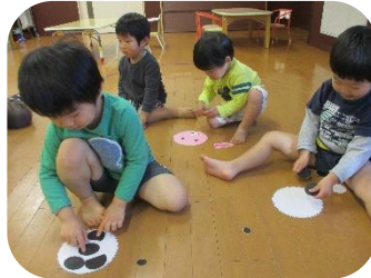
福笑いあそび 顔のパーツを使ってお顔作り