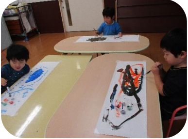
書初め遊び 長い紙 大きい紙に筆を使って・・・