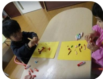
デカルコマニー 節分の鬼のパンツに使います